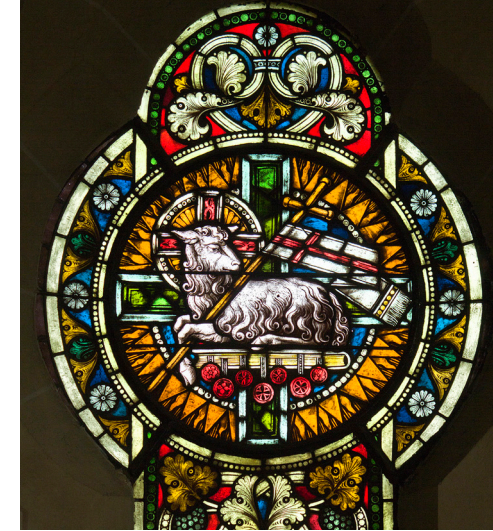
Geistliches und kulturelles Zentrum seit über 100 Jahren: Die Evangelische Johanneskirche in Laggenbeck.