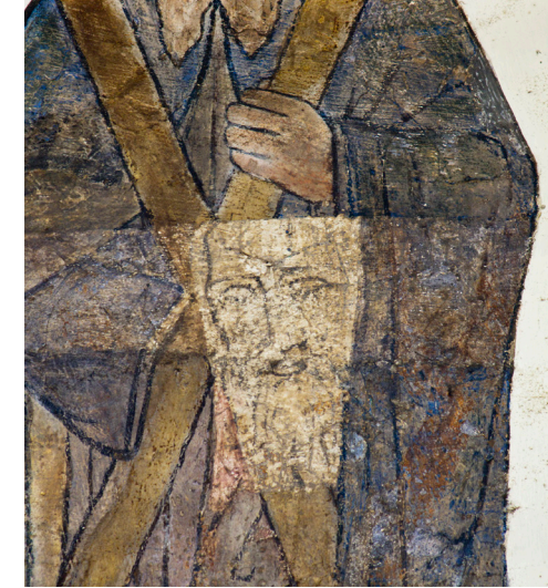
Geistliches und kultruelles Zentrum seit über 900 Jahren: Die Evangelische Kirche in Mettingen.